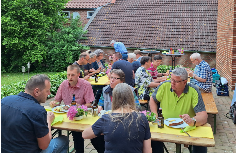
17. Mai 2024 – Treffen des Kirchenvorstands Amdorf-Neuburg und Detern