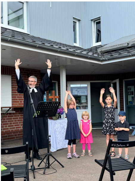
28. Juli 2024 – Sportplatz-Gottesdienst