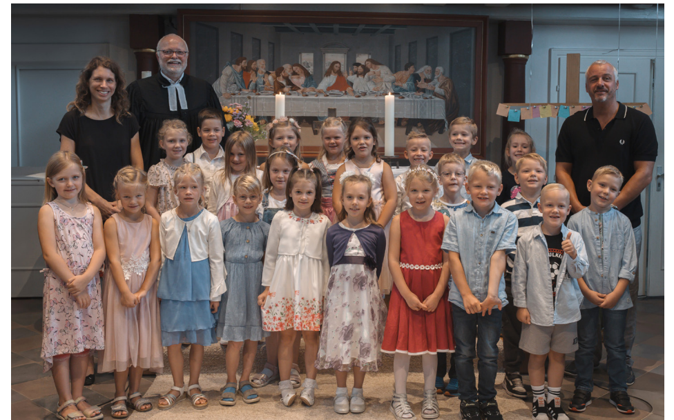
10. August 2024 – Schulanfänger-Gottesdienst