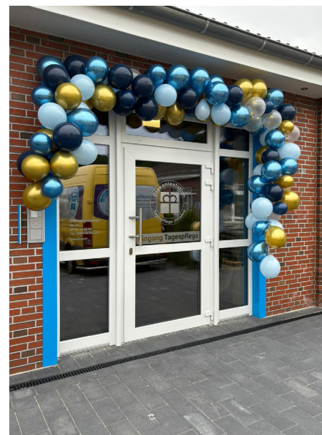
Türbogen zur Eröffnung der Tagespflege

Die liebevoll gestalteten Räumlichkeiten und das vielfältige Programm sind darauf ausgerichtet, den Gästen ein Gefühl von Geborgenheit und Aktivität zu vermitteln. Wer Interesse an diesem Angebot hat, kann sich unter der Telefonnummer 04956 92825-200 beraten lassen.