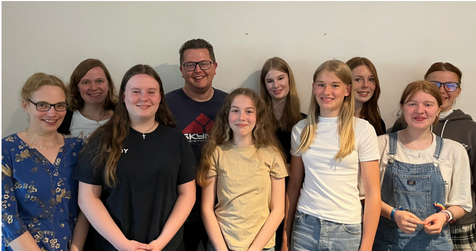
Ein großer Teil unseres fünfzehnköpfigen Mitarbeiterteams

Um einen Eindruck vom Programm im Kindergottesdienst zu bekommen, schaut gerne auf Instagram unter @kindergottesdienstdetern vorbei.