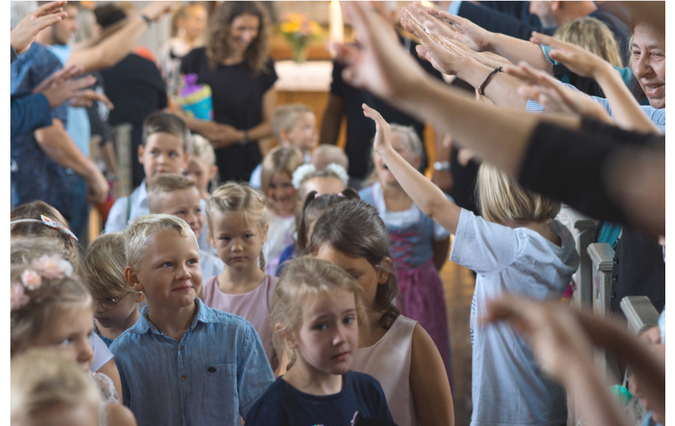
10. August 2024 – Schulanfänger-Gottesdienst